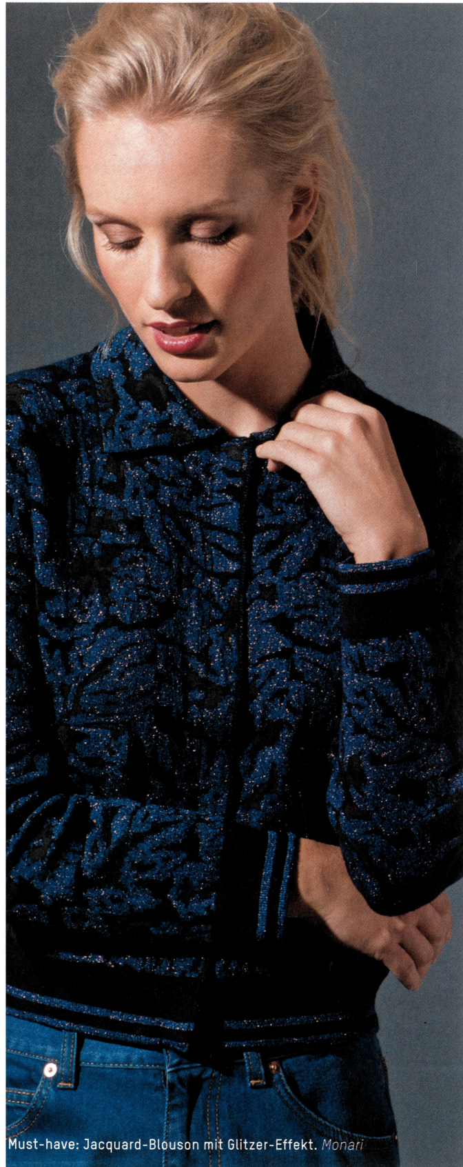
Must-have: Jacquard-Blouson mit Glitzer-Effekt. Monari

Der PULLOVER gewinnt. Strickmäntel bekommen Struktur. Jacquards und Lurex-Effekte sind die Schmücker. Diese KEY-PIECES favorisieren die Kreativen: